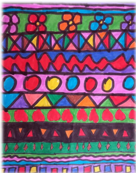
Autor – Geanina Revnic