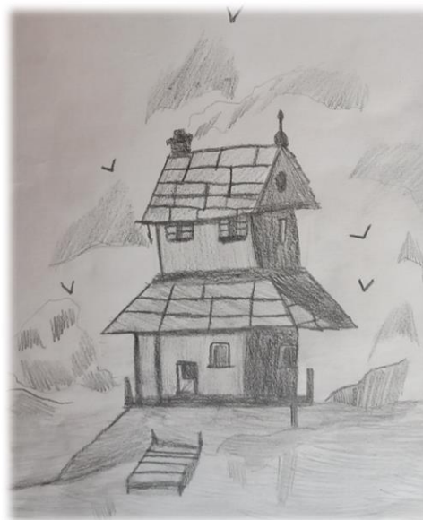
Autor – Larisa Mădălina