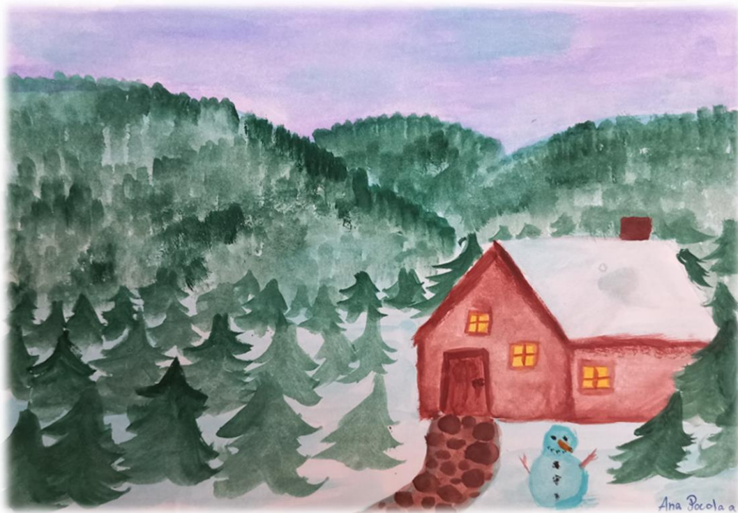
Această pictură a fost realizată de către eleva Ana Pocola