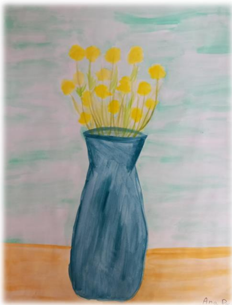
Autor – Ana Pocola